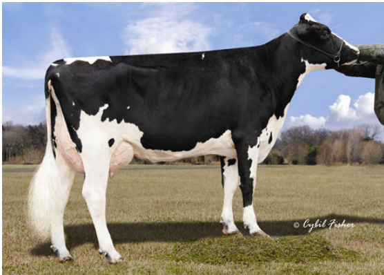
CLEAR-ECHO M-O-M 2213 THIRD DAM